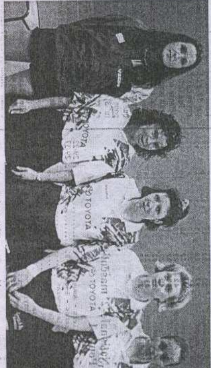
L'équipe de Mondreville championne de France de nationale 1 féminine