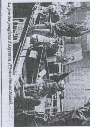
La joie des pongistes d'Argentin.