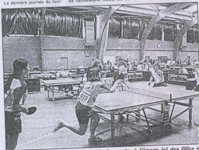
Les doubles ont parfois tiré des duels serrés, à l'image ici des filles de Mondeville face à Rilleux.